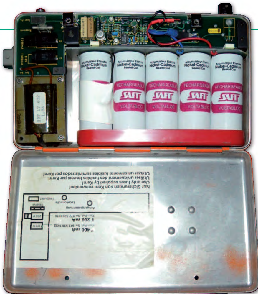
Wnętrze oryginalnego akumulatora

kim ciśnieniu i temperaturze powietrza -20°C poprawka wynosi 7 mm na 100 m. Przy skrajnie niskim ciśnieniu, np. na szczycie Mount Everestu i przy temperaturze ponad 40°C ( reducto ad absurdum ) – 15 mm na 100 m. Metodą empiryczną, mierząc boki osnowy o różnych długościach oraz poprzez porównanie z pomiarem z dalmierza Disto, sprawdziłem czy błąd pomiaru odległości mojego Kerna ma charakter liniowy czy też stały (tab. 1).