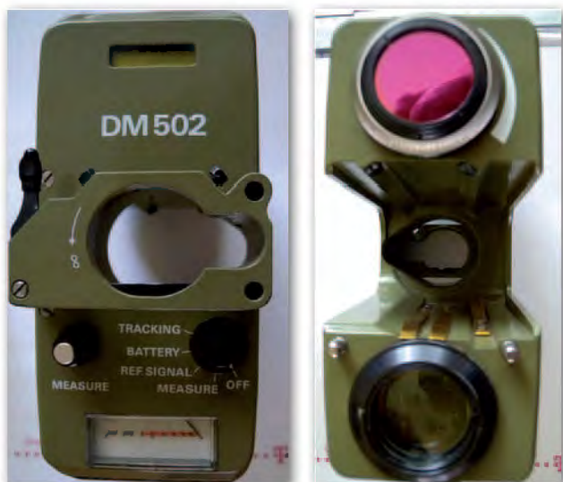
Moduł dalmierczy widziany od tyłu i od przodu (dolny obiektyw to nadajnik, górny z czerwonym filtrem – odbiornik)

3. W pozycji Reference Signal wskazówka wędruje na zielone pole skali.