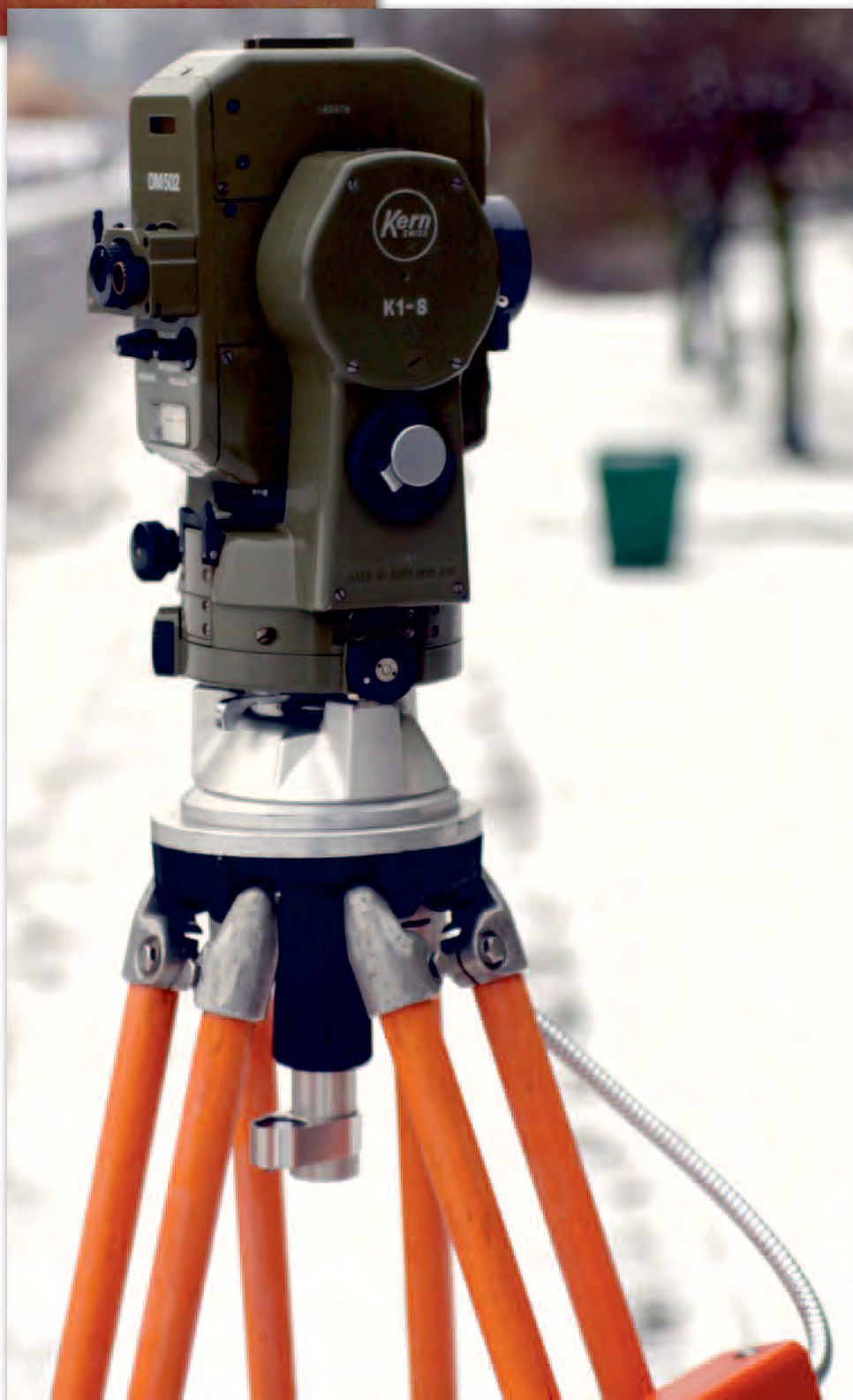
Instrument gotowy do pracy

Kolej na sprawdzenie w terenie. Wykonałem pomiar w 6 seriach długości boku osnowy poziomej III klasy. Wyszło z nich, że średnia odległość zmierzona moim DM 502 jest o 6 cm krótsza od wzorcowej. Trzeba więc wprowadzić poprawki. Na obudowie akumulatora znajduje się diagram poprawek za warunki pogodowe. I tak, przy wyso-