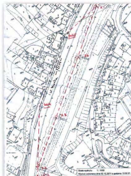
Mapa naniesioną bazą pomiarową