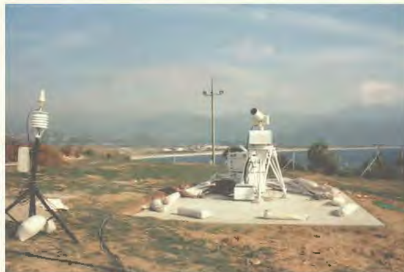
Abb. 3: E2-SD: links: kurz vor der Auslieferung in der Leica PMU in Unterentfelden, rechts: implementiert im Gesamtsystem FTLRS bei einer Messkampagne auf Kreta.