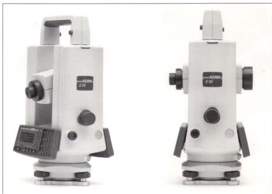
Abb. 1: E10 Design-Modell.

Kern war 1985 mit den elektronischen Theodoliten E1 und E2 und dem modularen Distanzmesser DM50x mit einer präzisen und bewährten Theodolit- und Tachymeter-Familie auf dem Weltmarkt präsent. Technische Neuentwicklungen in Sensorik und Informatik, sowie der vor allem durch japanische Konkurrenten verursachte ständig wachsende Preisdruck, führten bei Kern in Marketing und F&E zu Grundsatzüberlegungen über eine technologisch hochstehende, kostenoptimierte und damit wieder konkurrenzfähige Nachfolgenergeneration elektronischer Tachymeter. Im Oktober 1985 wurde von der Geschäftsleitung eine interne Projektstudie «Nachfolgeinstrumente E1/E2» in Auftrag gegeben, die neben einer Marktanalyse die Erarbeitung von Grundlagen für ein Pflichtenheft zur Produktentwicklung einer Nachfolgenergeneration zum E1/E2 zum Inhalt hatte. Bereits im Februar 1986 war das Pflichtenheft für die Produkteentwicklung fertiggestellt. Unter der Projektnummer 1105 und mit dem Projektnamen «E10» für den ersten Spross der neuen Instrumentenfamilie begann man umgehend mit deren Entwicklung.